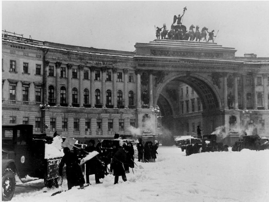
УБОРКА СНЕГА НА ПЛОЩАДИ УРИЦКОГО В БЛОКАДНОМ ЛЕНИНГРАДЕ.