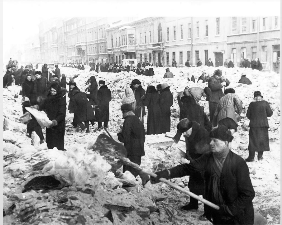
РАБОТАЮТ НА ВОСКРЕСНИКЕ ПО ОЧИСТКЕ ГОРОДА НА ПРОСПЕКТЕ ВОЛОДАРСКОГО.